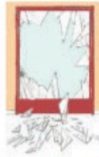
Lámina que no se ve y nos protege del viento. Aunque la atraviesa el sol, se empaña con el aliento.